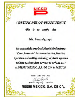
Constancia del Curso